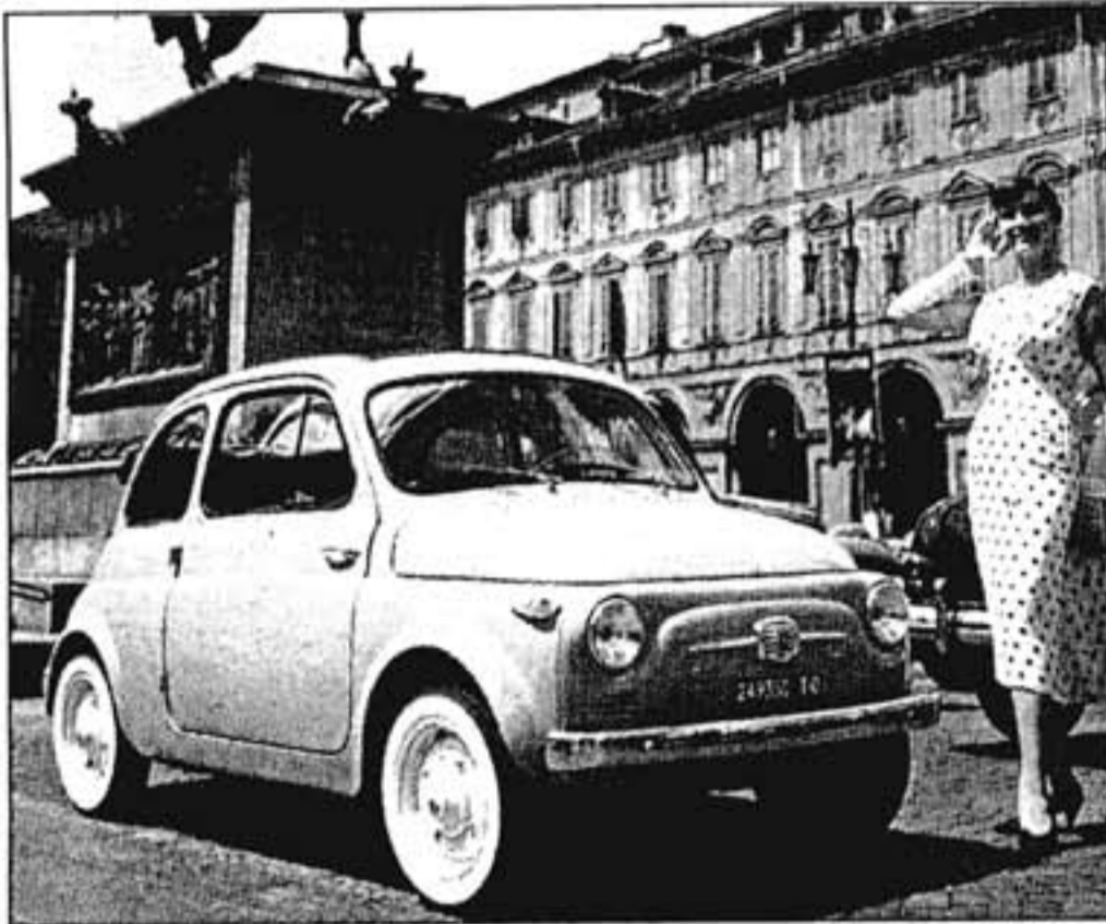
Cinquant'anni fa veniva pubblicizzata così la mitica 500

«Anche quest'anno sono lieto di presentare Roaring Spot, i Leoni di Cannes a Ferrara, giunto alla sua quarta edizione e vivo più che mai anche grazie all'importante premio ricevuto dalla TP nel 2006 nell'ambito del Communication